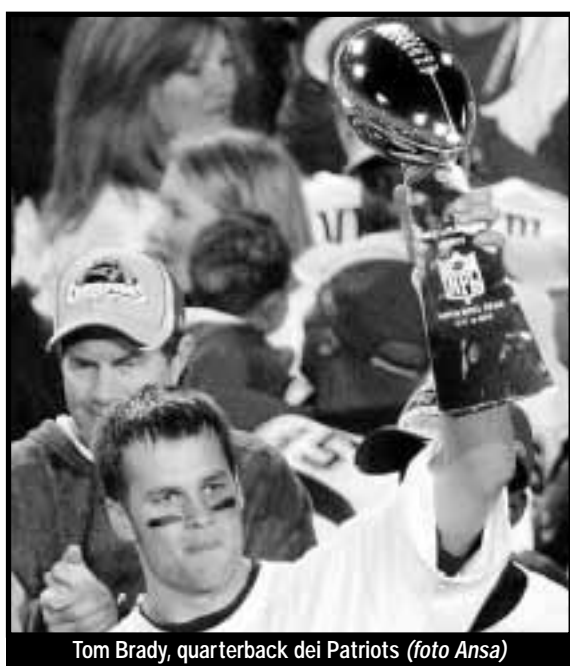
Tom Brady, quarterback dei Patriots

Spettacolare l'intervallo musicale affidato all'ex Beatle Paul McCartney che ha presentato una miscelanea di successi. Dopo lo scandalo del 2004, quando Janet Jackson mostrò il seno durante lo show musicale, stavolta lo spettacolo si è svolto senza inconvenienti. Intense le misure di sicurezza: al match hanno assistito anche gli ex-presidenti Bill Clinton e George Bush senior.